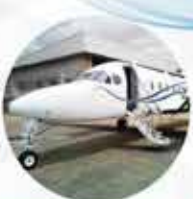
KING AIR 350i