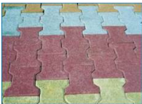
Pavés autobloquants en béton teinté