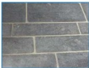
DALLES : Exemple de calepinage